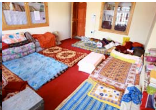
slaapkamer Gephel Shadrubling