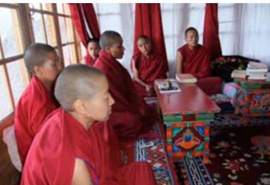
Gompa Gephel Shadrubling

Een groep nonnen maakte zich een aantal jaren geleden los van het Mahabodhi-klooster (omdat zij daar niet meer het in Ladakh gebruikelijke Tibetaanse boeddhisme konden praktiseren). Deze nonnen zijn bezig met de bouw van een eigen klooster. Met Britse steun hebben ze al een klein gebouw neergezet in Sabu. Een aantal van hen studeert net als de LNA-nonnen aan het Central Institute for Buddhist Studies in Leh. Daar volgen ze filosofielessen, maar ook leren ze traditioneel Tibetaans houtsnijden en schilderen, waarmee ze in de toekomst eigen inkomsten kunnen krijgen. Enkele nonnen studeren in Kathmandu, Dharamsala en in Karnataka. Een deel van de nonnen zoekt nog een sponsor. We bedanken camping les Matherons in Zuid Frankrijk dat zij hun foienpot van de zomer, € 860, aan dit klooster hebben geschonken. Zulke initiatieven zijn creatief en welkom.