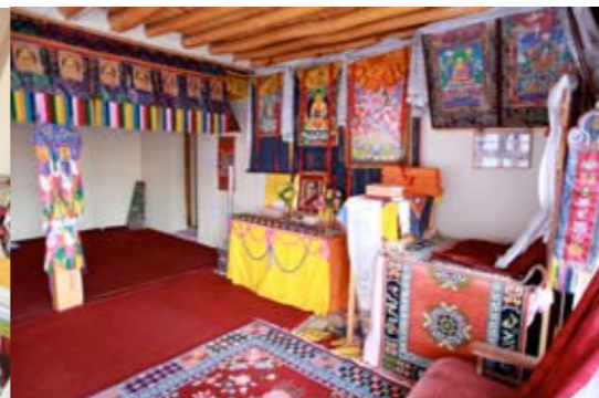
gompa Gephel Shadrubling