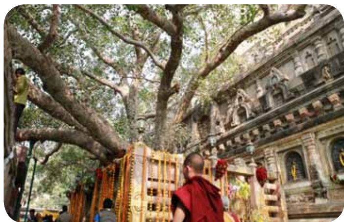
Boom in Bodhgaya waaronder Boeddha werd verlicht